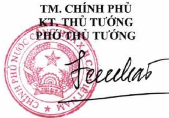
Lê Minh Khái